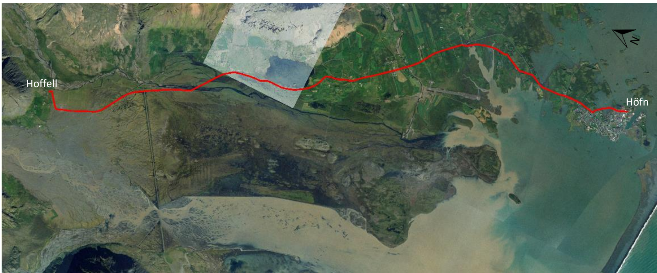
MYND 1. Yfirlitskort af lagnaleið (merkt með rauðu)